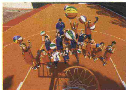
VIVA LO SPORT Nella Sport Academy i ragazzi dai 5 ai 16 anni si allenano con gli ex campioni.

● Su www.sardegnaturismo.it trovate gli itinerari più belli